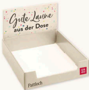
LeerdDisplay „Gute Laune aus der Dose“ Maße: (H) 145 x (B) 185 x (T) 200 mm EAN 4260308343278

Ihr*e Verlagsvertreter*in berät Sie gern bzgl. der Bestückung.