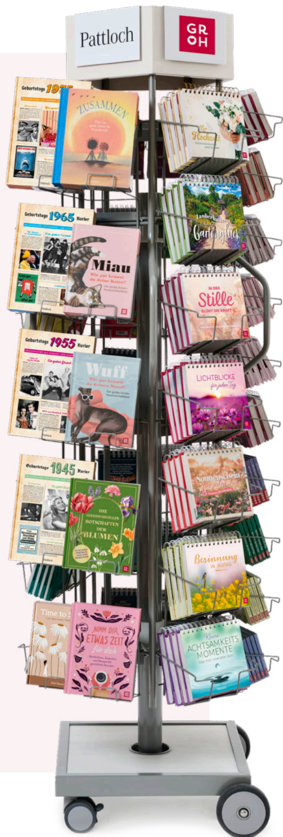
Stellagro Vario-Drehsäule H 190 cm, Ø 52 cm, Leitern variabel kombinierbar