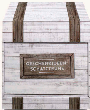
Geschenkideen Truhe Maße: (H) 33,5 x (B) 32,5 x (T) 34 cm EAN 4036442801123