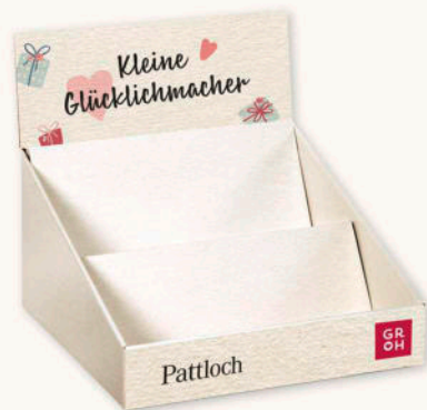
LeerdDisplay Mini „Kleine Glücklichermacher“ Maße: (H) 245 x (B) 260 x (T) 260 mm EAN 4036442801109