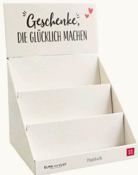
LeerdDisplay Multiformat Maße: (H) 500 x (B) 375 x (T) 310 mm EAN 4036442800607