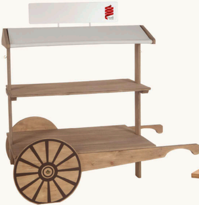
Deko „Marktwagen“ Maße: (H) 70 x (B) 70 x (T) 40 cm inkl. Griffen und Topper-Schild (austauschbar) EAN 4036442801116