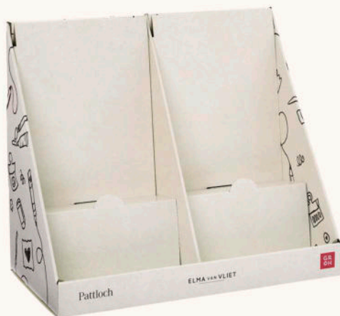
LeerdDisplay Mal- und Kritzelbücher Maße: (H) 315 x (B) 365 x (T) 186 mm EAN 4260308345142