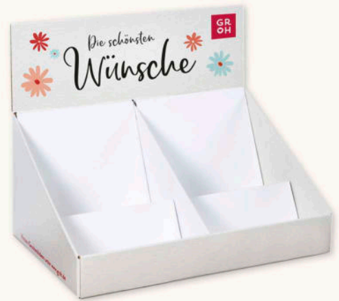
LeerdDisplay Classic „Die schönsten Wünsche“ Maße: (H) 302 x (B) 370 x (T) 275 mm EAN 4036442801147