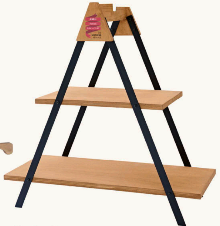
Deko „Etagere“ Maße: (H) 68 x (B) 65,1 x (T) 25 cm EAN 4036442801345